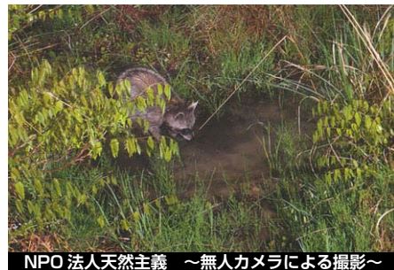
NPO 法人天然主義 ～無人カメラによる撮影～