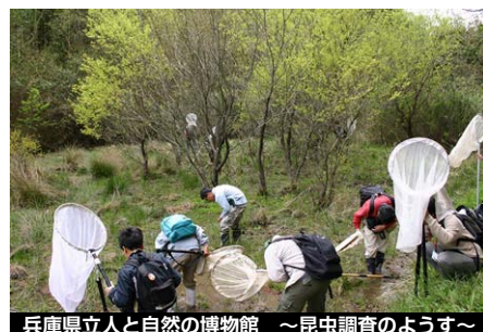
兵庫県立人と自然の博物館 ～昆虫調査のようす～