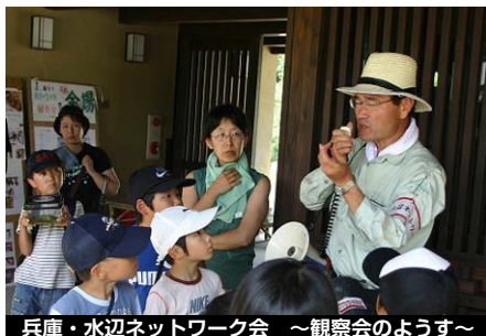
兵庫・水辺ネットワーク会 ～観察会のようす～