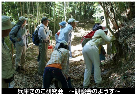
兵庫さのこ研究会 ～観察会のようす～