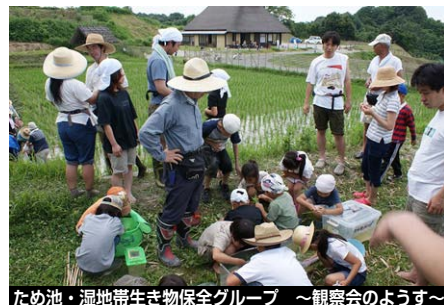
ため池・湿地帯生き物保全グループ ～観察会のようす～