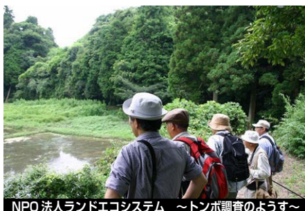
NPO 法人ランドエコシステム ～トンボ調査のようす～